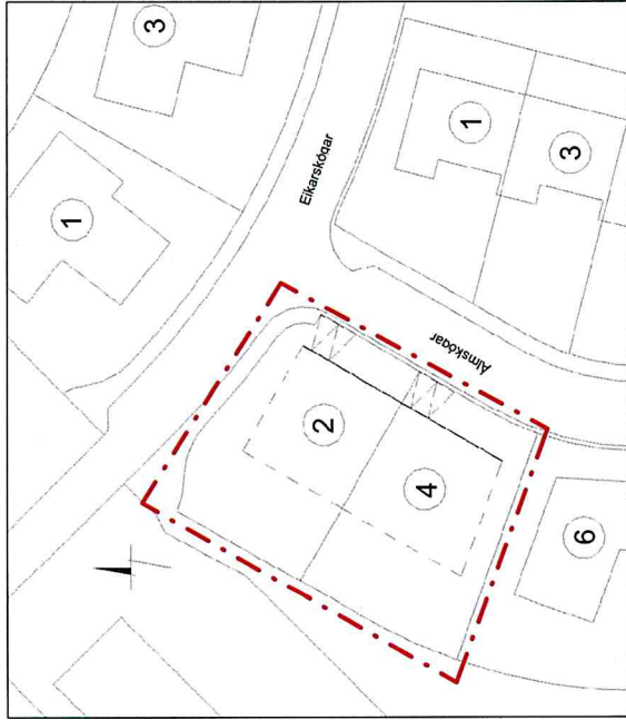
Hluti deiliskipulags af Skógarhverfi 1. áfangi fyrir breytingu í gildi frá júní 2006.